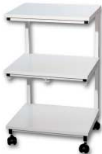
CARRELLO PORTASTRUMENTI TROLLEY