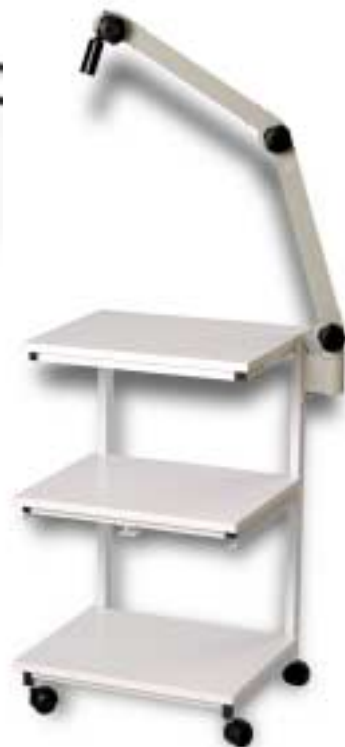
CARRELLO CON BRACCIO PANTOGRAFO TROLLEY WITH PANTOGRAPH BEARING FOR HANDPIECE